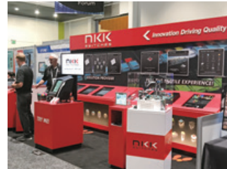
Display Week 2019