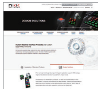
北米の新ソリューションホームページ

NKKは今後も、世界で最も知られ、世界で最も好まれ、世界で一番選ばれる スイッチサプライヤーを目指し、邁進してまいります。